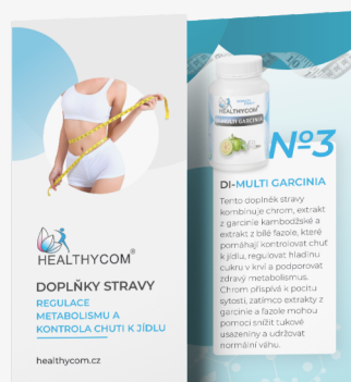
Regulace metabolismu a kontrola chuti k jídlu