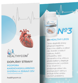
Podpora kardiovaskulárního systému a zdraví cév