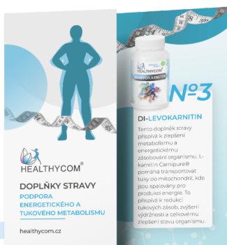
Podpora energetického a tukového metabolismu