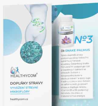
Vyvážení střevní mikroflóry