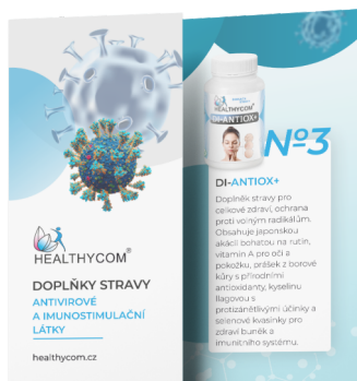
Antivirové a imunostimulační látky