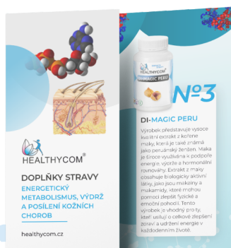
Energetický metabolismus, výdrž a posílení kožních chorob