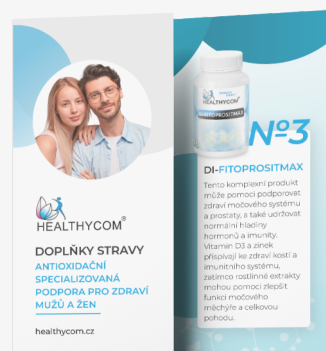
Specializovaná podpora pro zdraví mužů a žen